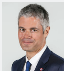
Laurent Wauquiez Président de la Région Auvergne-Rhône-Alpes Co-président de l'agence