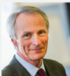
Jean-Dominique Sénard Président du groupe Michelin Co-président de l'agence