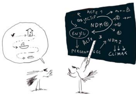
Dessin de Charlie Belin (promotion 2015)

Le travail réalisé reste la propriété de l'auteur.